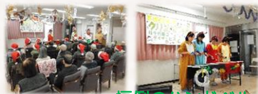
恒例のハンドベル♪